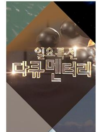
SBS 다크로 세상을 읽는다!