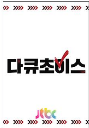
우리 삶의 다양한 선택