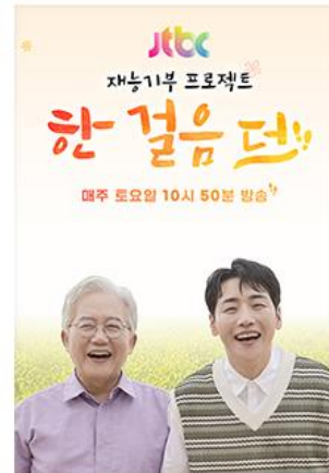
기적의 힐링 메디컬 다크