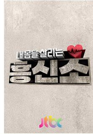
건강 사건 해결 100% !!