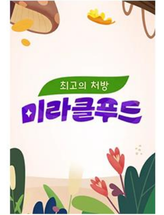
[6년째 방영중] 메디컬 특강 쇼