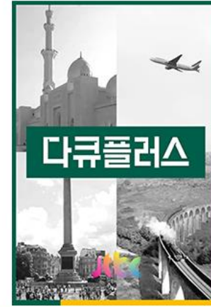
JTBC 베스트 다크 프로그램