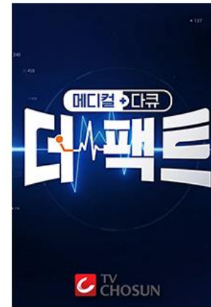
TV CHOSUN의 추적 메디컬 다크