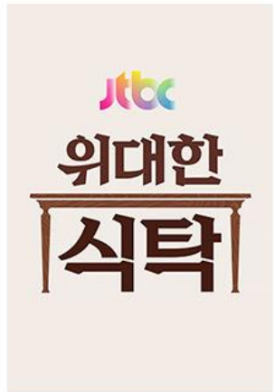
은밀하고 위대하게, 식탁을 바꿔라